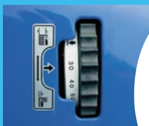
6 fokozatú vágásmagasság állítgás 30, 40, 50, 60, 80 és 90 mm