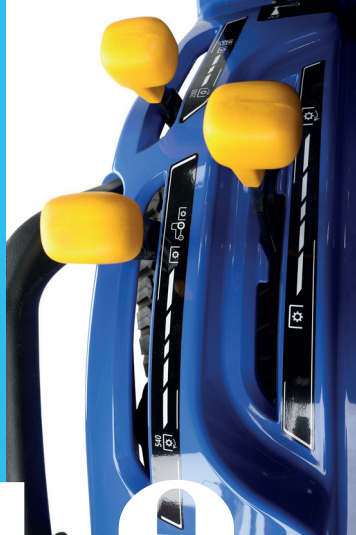
Ergonomikusan elrendezett kardántengely kezelő karok