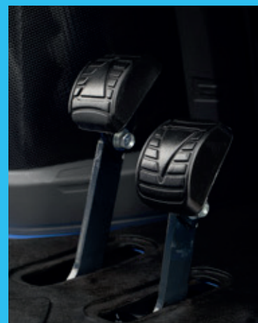
A hidrosztatikus hajtást vezérlő pedálok