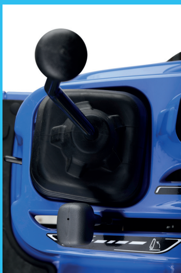
Joystick vezérlő „központ” a komplett hidraulikavezérléshez