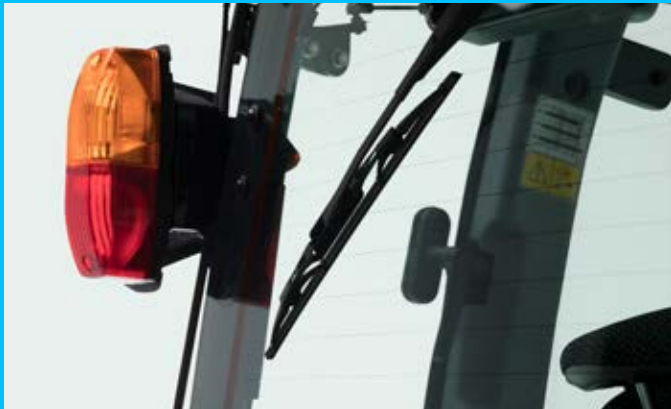
A fűthető hátsó szélvédő és ablaktörlő széria felszereltség

A kiegészítő fényszórókra akkor van szükség, amikor az előre szerelt munkaeszköz, pl. egy hótolólap eltakarja az első fényszórókat. A megújult modellekben a hagyományos fényszórókat LED-technológiára cserélték, amivel az energiafelhasználás töredékére csökkent és lényegesen javult a munkaterület megvilágítása.