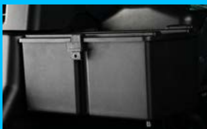
Tárolóhely az alapvető dolgoknak. Zárható szerzsámos láda a hátsó sárvédőnél (opció)