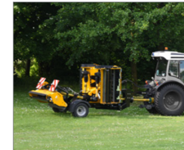
A kis szállítási méretek és a széles gumibroncsokkal szerelt futóműszerkezet gondoskodnak a csendes és talajkímélő haladásról.