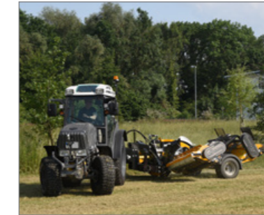
Az egyszerű kezelhetőség érdekében külön kivitelezett összecukó- és fordulóhenger.