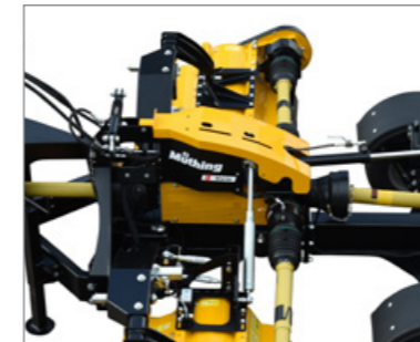
Rendezett: fedélzeti hidraulika az MU-SOFA® hidropneumatikus talajnyomás-tehermentesítővel.