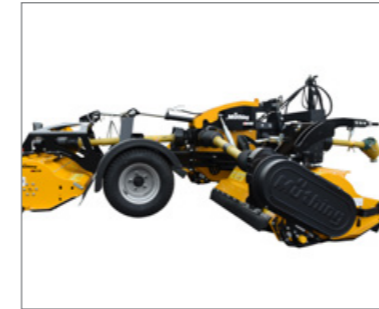
Hatékony hajtáslánc, kompakt kivitelben, nagy hajtásteljesítményekhez.