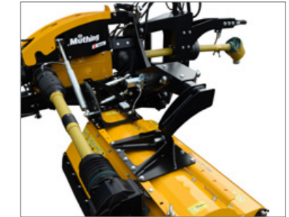
A két oldalsó mulcsozó vontatott felfüggesztése lehetővé teszi a folyamatos kontúrkövetést, egyenletes vágásmagassággal.