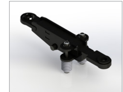
A mechanikus ütközés elleni biztosítás komoly esetekben hatékonyan kifordítja a mulcsozót az ütközési tartományból.