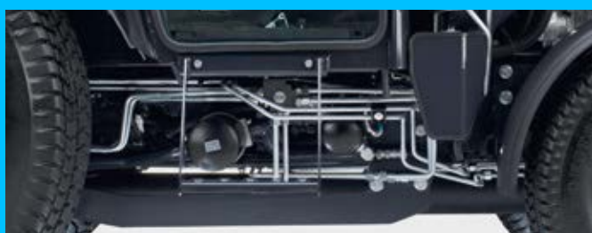
Robosztus és hatékony hidraulika rendszer acél vezetékekkel

Légrugózású ülés, magasságban fokozatmentesen és rugózási intenzitásban állítható.