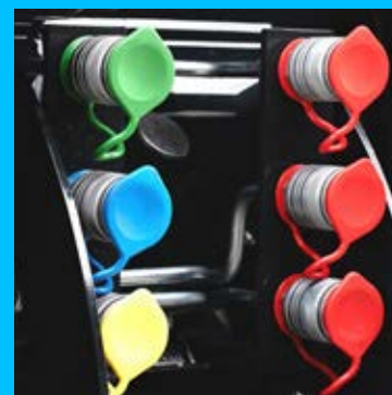
Akár három pár hátsó kihelyezett hidraulikakör