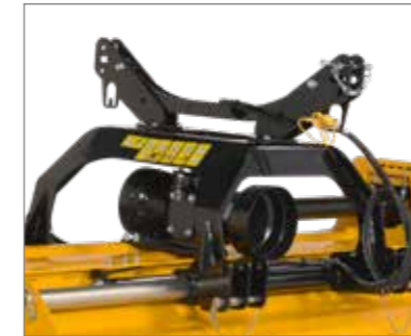
Mind a traktor elejére, mind a hátuljára felszerelve használható (opció).