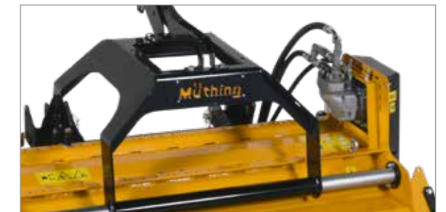
Az erős axiáldugattyús motor hidraulikus hajtásnál is megfelelő teljesítménytartalékot biztosít.