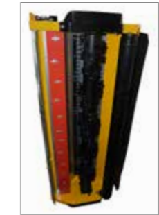
MU-Vario® rendszer optimalizált bemenet- és házfornával és a fokozatmentesen választható aprítási fokkal. Így könnyen elérhető az optimális mulcsmínőség és szárzúzás.