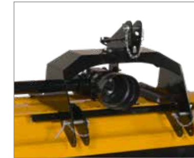
Hordozójárművekhez rendelkezésre áll egy speciális, 1 kategóriájú hárompontos függesztőszerkezet.