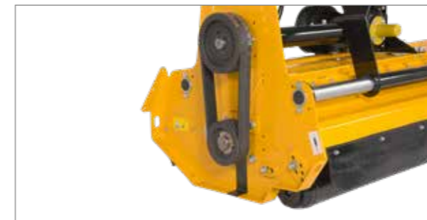
540 vagy 1.000 1/min kardántengely-fordulatszámok is lehetségesek.