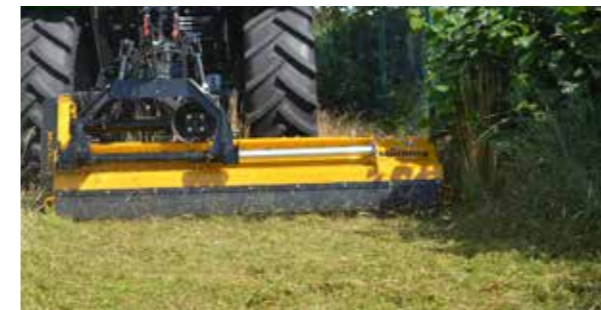
Hidraulikus oldaleltolás: a traktor mellett eltolt géppel végzett mulcsozás nagyfokú rugalmasságot biztosít fáknál, behajtóknál vagy más akadályoknál (opció).