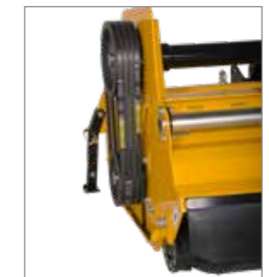
540 vagy 1.000 1/min kardántengely-fordulatszámok is lehetségesek.