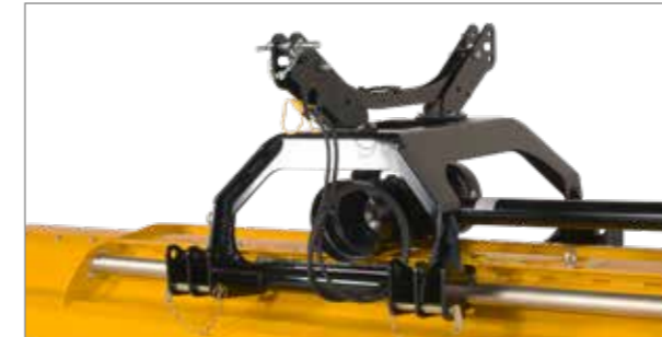
Mind a traktor elejére, mind a hátuljára felszerelve használható (opció).