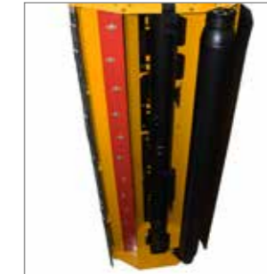
MU-Vario® rendszer optimalizált bemenet- és házfornával és a fokozatmentesen választható aprítási fokkal. Így könnyen elérhető az optimális mulcsminőség és szárzúzás.