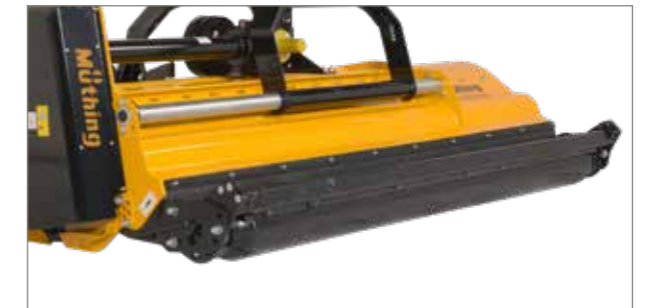
Két stabil adapterlap segítségével megvalósítható, hogy a gép a támasztóhenger elé helyezze el az anyagot (opció).