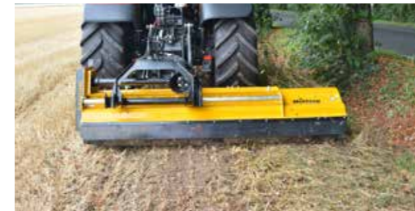
Hidraulikus oldaleltolás: a traktor mellett eltolt géppel végzett mulcsolás nagyfokú rugalmasságot biztosít fáknál, behajtóknál vagy más akadályoknál (opció).